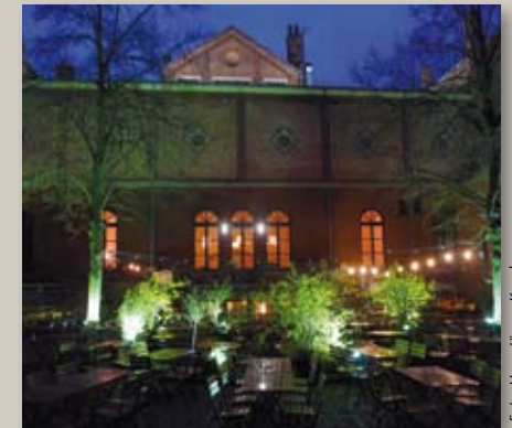
Stimmungsvolles Ambiente: Das Künstlerhaus in der Sophienstraße.

Bis auf wenige Ausnahmen sind alle Veranstaltungen des Festivals kostenlos. Lediglich für einige Filme, die das Kommunale Kino an den vier Tagen unter dem Titel „Die philosophische Leinwand“ zeigt, wird Eintritt verlangt. Das Festival soll nicht nur Erwachsene anziehen, auch Kinder und Jugendliche soll die Lust am Fragen und Durchdenken packen. Für Studenten der Philosophie sei die Vortragsreihe „Philosophie als Beruf“ empfohlen, Experten von der Arbeitsagentur wollen mit dem Vorurteil aufräumen, dass Philosophen nur vom Taxifahren leben.