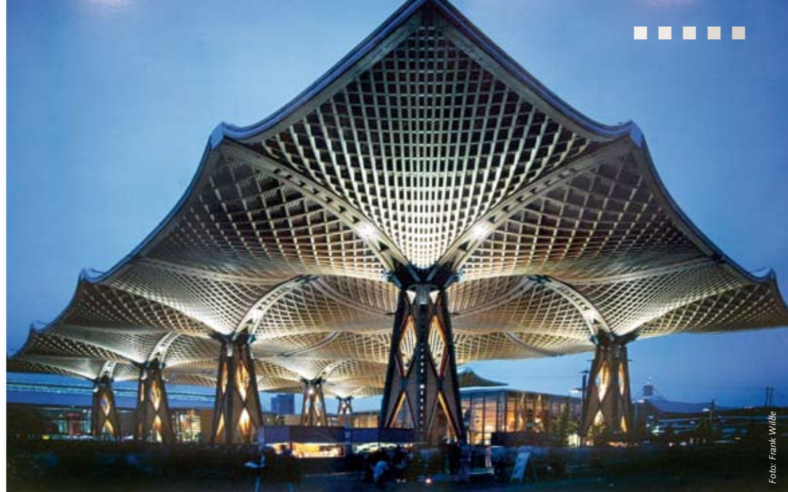
Nachhaltiges Bauen: Das größte freitragende, von Weißtannen gestützte Holzdach der Welt bleibt als Wahrzeichen der EXPO 2000.