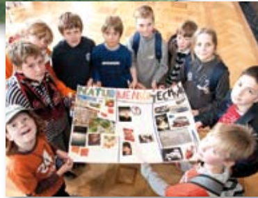
Mit dem Thema Mensch & Natur beschäftigen sich Gymnasiasten.