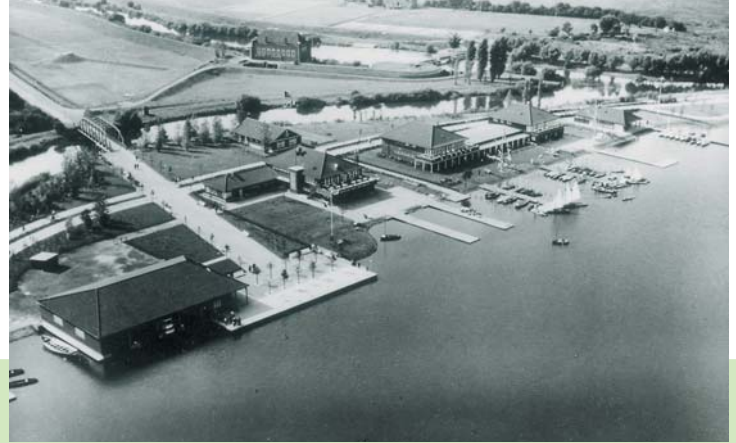
VOGELSCHAU DES WESTANLEGRERS, SOMMER 1937

Ausbaus von 1936, denkmalgerecht grundsaniert. Zum Ensemble der teilweise mit Dolomitplatten ausgelegten Promenade gehören die natursteinverblendete Säule mit dem „Fackelträger“ (2), der Musikpavillon und auch die kleine Bogenfontäne im Wasser. Hier herrscht nicht nur zu den Volksfesten der Trubel einer Großstadt. Unter den alljährlich im Sommer aufgestellten Palmen kann man auch in lauen Sommernächten flanieren.