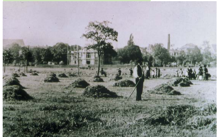
HEUERTE AUF DEN MASCHWIESEN UM 1888

Das fruchtbare und zur Heugewinnung gut nutzbare feuchte Wiesenland in der Niederung von Leine und Ihme galt von alters her als unbebaubar und wurde als Viehweide genutzt. Deshalb erstreckte sich noch am Ende des 19. Jahrhunderts die sogenannte Masch oder Ohe bis an die