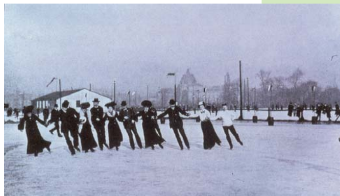
EISBAHN AUF DER MASCH, 1910