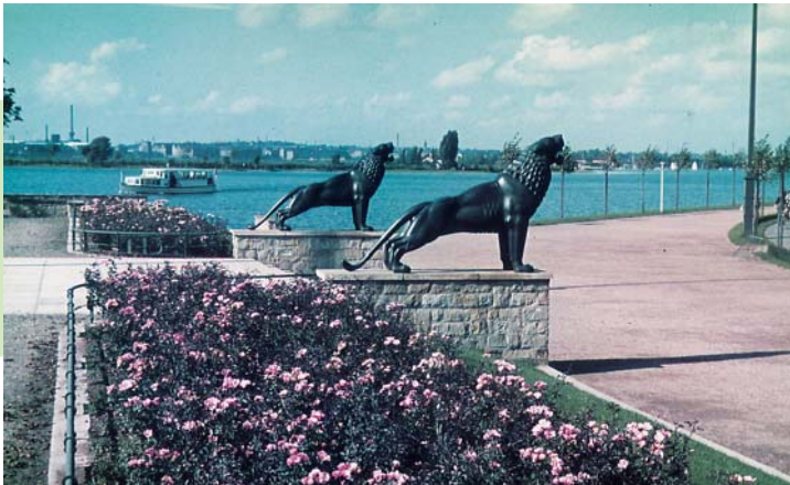
LÖWENBASTION NACH 1938

Das Maschseebecken erreicht südlich von hier seine größte Breite und wird von nun an durch Weiden, Erlen und andere standortgerechte Gehölze natürlich umsäumt.