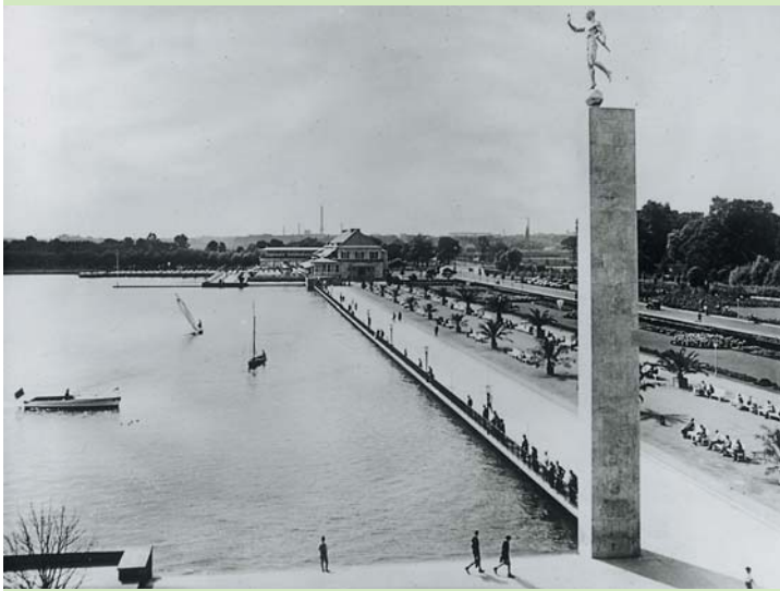
MASCHSEE-NORDUFER NACH 1936

Der Kaffeeduft der Gaststätte, ein flotter Marsch vom Musikpavillon und die sich sanft in einer Maschseebrise wiegenden Palmen zwischen den zahlreich aufgestellten Bänken verbreiteten ein südländisches Flair. Anwohner erinnern sich: „Jung und Alt promenierte – beinahe wie in Monte Carlo.“