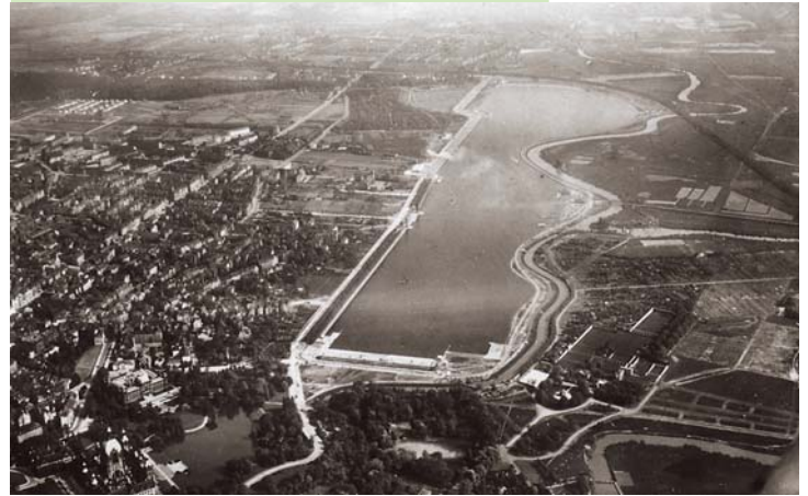
LUFTBILD DES MASCHSEES UM 1936

Es wurde bei jeder Witterung gearbeitet. Arbeitskleidung und -gerät mussten selbst mitgebracht werden. Der Wochenlohn betrug 15,50 Reichsmark (RM) in Zeiten, in denen beispielsweise ein Stück Butter bereits 3,20 RM kostete.