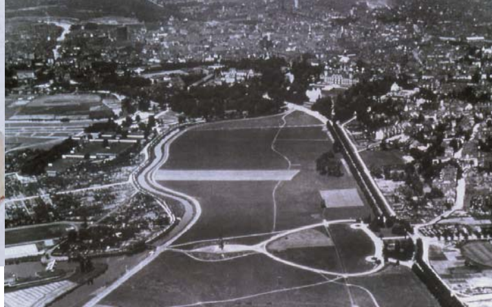
BLICK AUF DIE MASCHWIENEN MIT BISMARCKSÄULE, 1933