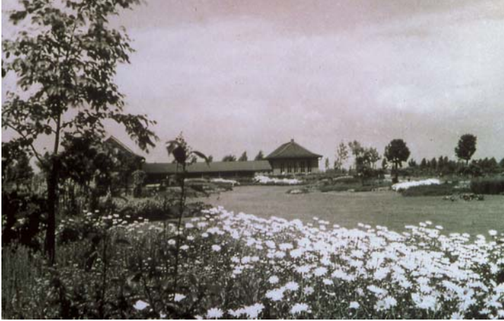
STAUDENGRUND UM 1940

Architektonischer Bezugspunkt des schönen Staudengrundes war und ist die Maschseequelle (15). Sie wurde als eine der ersten Bauten am Südwestufer bereits im November 1935 in Betrieb genommen und war als Pumpen- und Filterhaus für den Wasserhaushalt des Maschsees viele Jahre verantwortlich. Zwei Pumpen hoben 500 Liter Wasser pro Sekunde aus der Leine. Da Verluste durch Verdunstung und Versickerung entstehen, müssen dem See täglich circa 10.000 Kubikmeter Wasser zugeführt werden, um den Wasserspiegel konstant zu halten. Die Einspeisung von schwebstoffreichem Leinewasser führte dazu, dass der See schneller verlandete als befürchtet wurde. 1960 entschied die Stadtverwaltung ein neues Pumpwerk an den Ricklinger Kiesteichen zu erbauen, um den Maschsee zukünftig mit klarem Grundwasser zu speisen. Eine 800 Meter lange Pumpleitung führt das Wasser unterirdisch zum See. Es wird hauptsächlich über ein Einlassbauwerk seitlich der Maschseequelle eingeleitet. Wenn der Sauerstoffgehalt im See zu niedrig ist, beziehungsweise bei Festivitäten am Maschsee, fließt ein Teil des Wassers über das mehrstufige Kaskadenbecken zu.